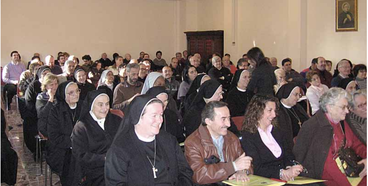
Roma, "Domus Urbis", 23-24 gennaio 2010: Assemblea Nazionale Movimento Laicale Guanelliano

presentazione dei Superiori Generali dei SDC e FSMP