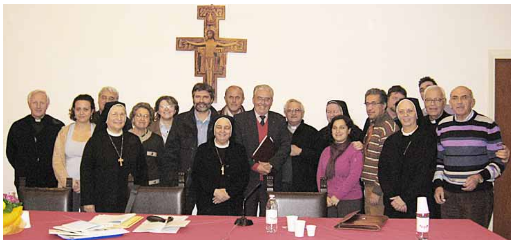
ROMA 23-24 gennaio 2010: Consiglio Nazionale MLG con i Superiori/e Generali e Provinciali

condivisione del carisma guaneiliano e la comunicazione tra i gruppi” (XVII CG SdC, proposizioni 55.56) e “di seguire con attenzione il cammino e lo sviluppo del Movimento Laicale Guanelliano” (XVI CG FSMP) confermiamo, con questo Documento, il comune impegno a promuovere il MLG per coordinare più efficacemente le varie espressioni esistenti di collaborazione laicale e di condivisione della spiritualità e della missione guaneiliana.